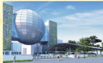
※掲載の画像は完成前のイメージです。