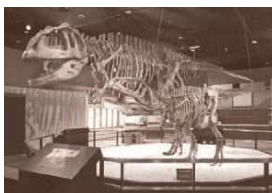
マブサウルス (生命館2階)