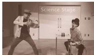
サイエンスステージ (天文館4階)