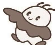
科学館マスコットキャラクター アサラ 👤-アストロ (宇宙) 👤-サイエンス (科学) 👤-ライフ (生命)