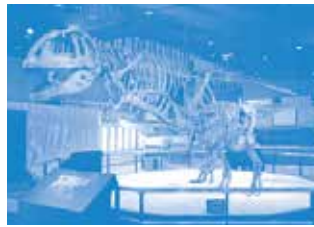
マザサウルス(生命館2階)

科学館マスコットキャラクター アサラ ☆アストロ(宇宙) ☆サイエンス(科学) ☆ライフ(生命)