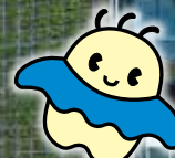
科学館マスコット キャラクター アサラ