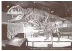
マップサウルス(生命館2階)