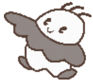
科学館マスコットキャラクター アサラ ① アストロ(宇宙) ② サイエンス(科学) ③ ライフ(生命)