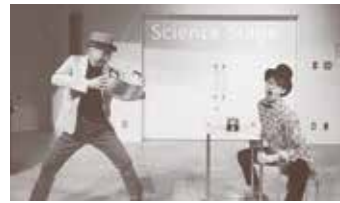
サイエンスステージ(天文館4階)