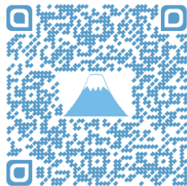
申込フォーム QRコード

中部科学技術センターホームページ 【 http://www.cstc.or.jp 】 新着情報に掲載の申込フォームまたは 下記URLからお申込みください。