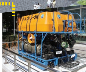
海洋無人探査機 ●ドルフィン3K 生命館南側に展示

その他にも、日本の宇宙実験棟「きぼう」の実験モデルや、以前から人気の市電や機関車も展示します。