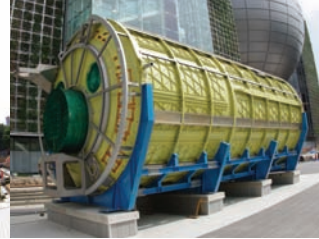
●「きぼう」船内実験室 (塗装前)